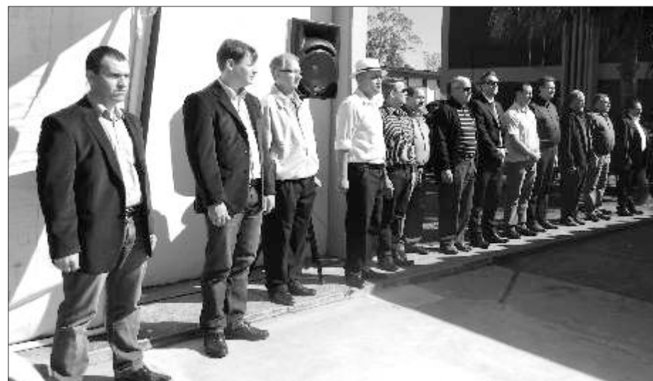
Militares da reserva e convidados