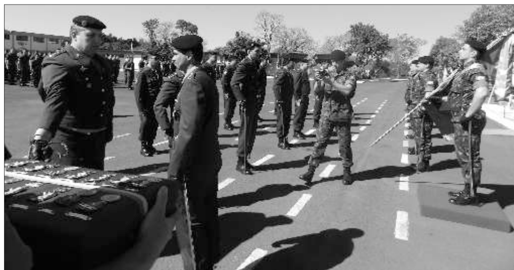
Medalha Militar pelos bons serviços prestados à Nação