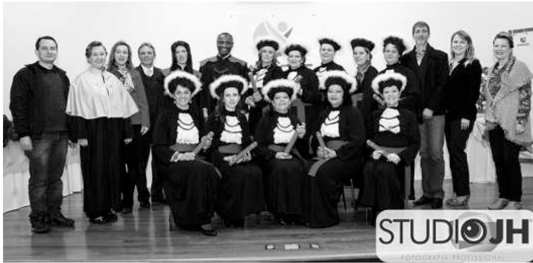
No dia 17 de agosto, aconteceu a formatura do curso de Ciências da Religião da Unoesc. Parabéns às formandas.