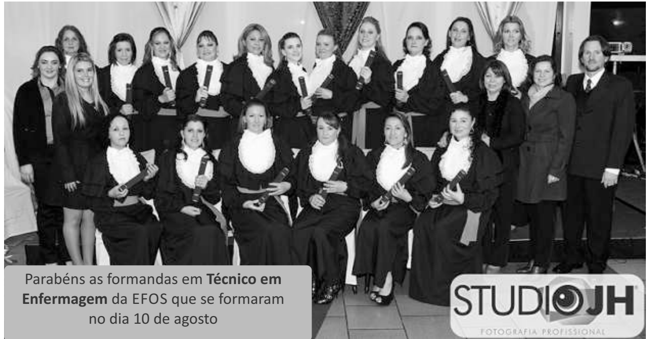
Parabéns as formandas em Técnico em Enfermagem da EFOS que se formaram no dia 10 de agosto