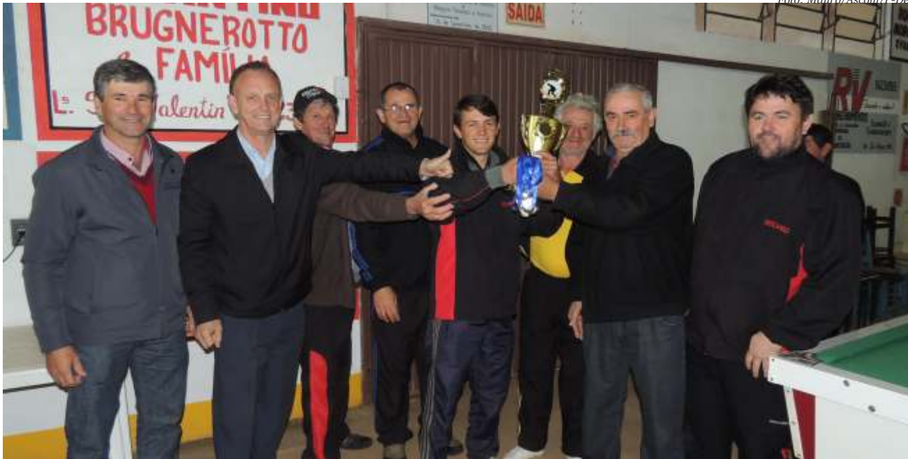
Campeonatos alem de incentivar diversas modalidades, aproximam a comunidade

Descanso A primeira taça Cristo rei de Bocha em trio movimentou várias equipes e um bom público em todas as rodadas.