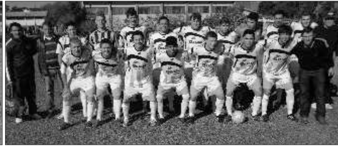
Pelo Principal: Corinthians Guaramirim x J. Peperi