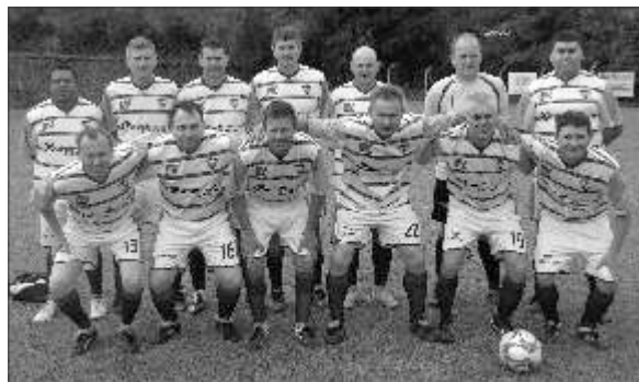
Veteranos: Grêmio da Linha Gaúcha x São Miguel

Jogos da segunda rodada acontecem neste final de semana em caso de tempo bom