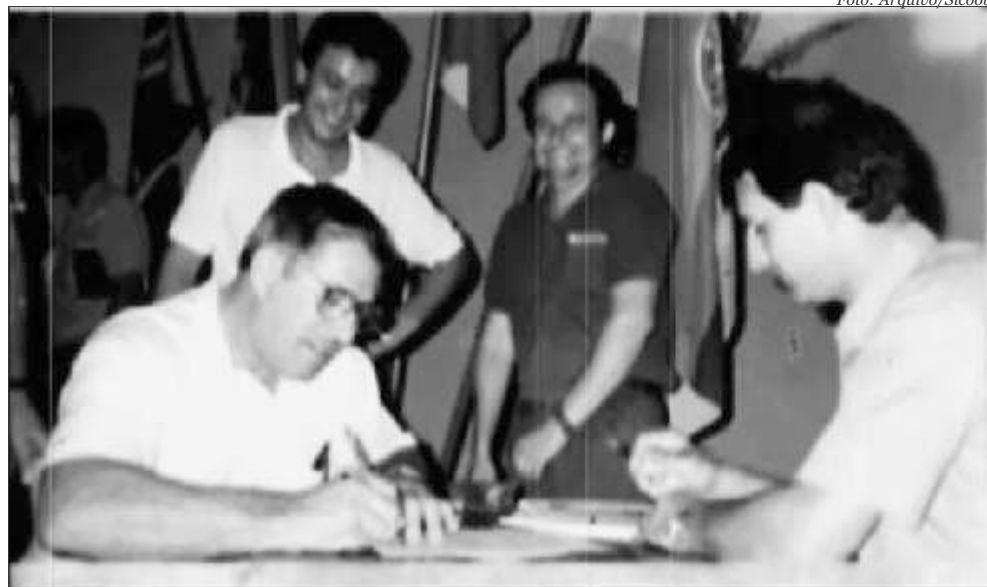
Fundação: Assinatura da Ata de Constituição

São Miguel do Oeste A Cooperativa de Crédito Rural de São Miguel do Oeste, hoje Sicoob São Miguel, foi fundada em 25 de julho de 1989, a partir da iniciativa e visão de futuro de 34 agricultores, movidos pela necessidade de acesso ao crédito rural, em uma época que havia muita dificuldade por parte da agricultura em conseguir recursos para financiar a produção.