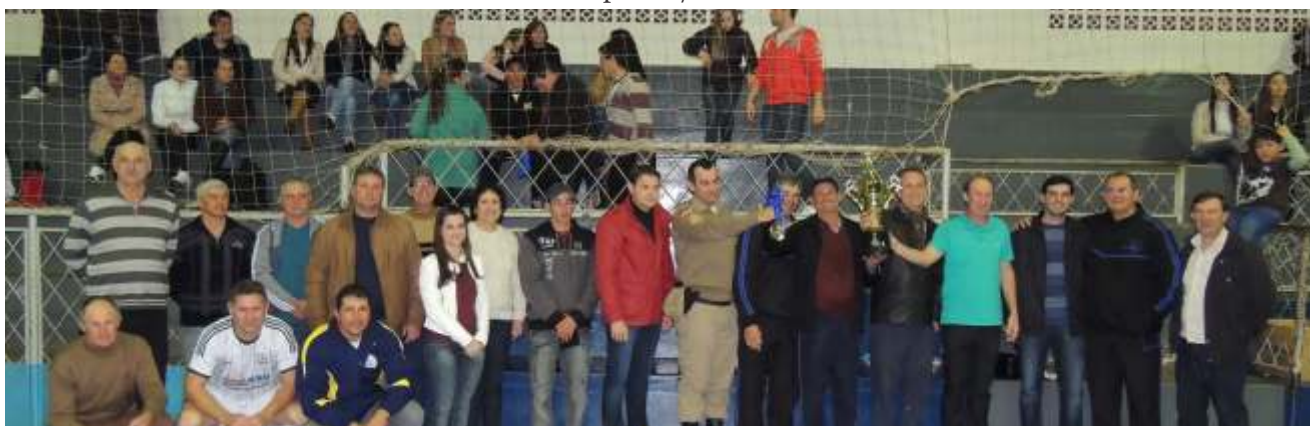
Campeonato envolveu equipes de 19 estabelecimentos do município

2º - Açougue Zandona 1º - HB Informática Livre Feminino 3º - Agropecuária Trifel 2º - Agro Ivo 1º - HB Informática Masculino livre: 3º - Dyanjo 2º - HB Informática 1º - Serralheria Descanso