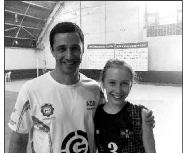
Município é destaque nacional no Voleibol com vários títulos e premiações