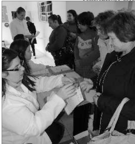
Exames preventivos e orientações foram o foco do encontro "saúde da mulher"

São Miguel do Oeste O evento ocorreu no Posto Central de Vacinas, disponibilizando exames e orientações, durante o dia todo, sendo organizado também em parceria com o Conselho Municipal de Saúde.