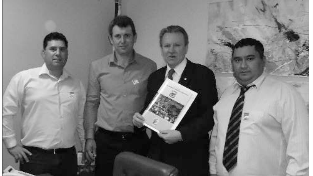
Recursos serão para compra de máquinas para fortalecer a agricultura