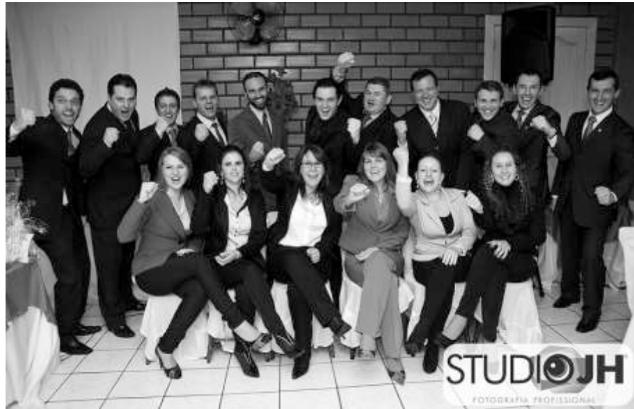
Formatura da 10ª turma da Dale Carnegie, que aconteceu no dia 24 de junho, nas dependências do Restaurante Novo Casarão. Parabéns!