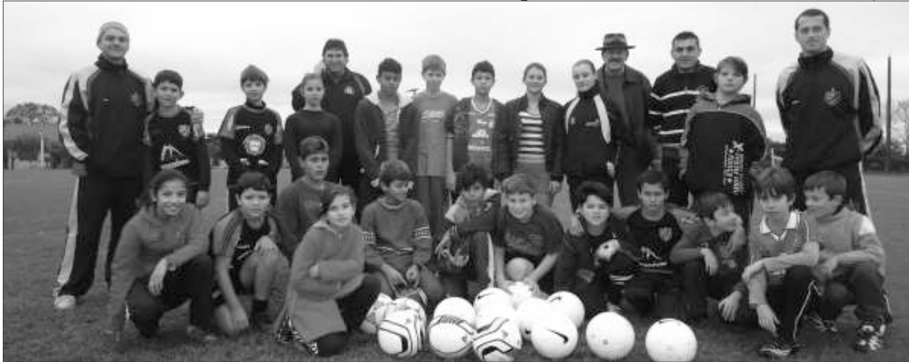
Projeto leva treino de futebol gratuitamente para crianças

São Miguel do Oeste O CT Bugre do Oeste recebeu no último sábado (22), 15 bolas oficiais de futebol de campo para o desenvolvimento do Projeto Gol Social, realizado em parceria com a Secretaria Municipal de Esportes.