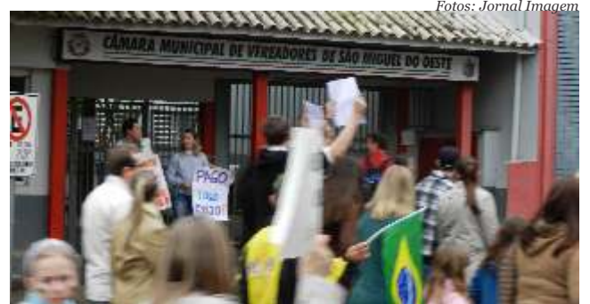
Manifestação passou em frente a prefeitura e a Câmara de Vereadores