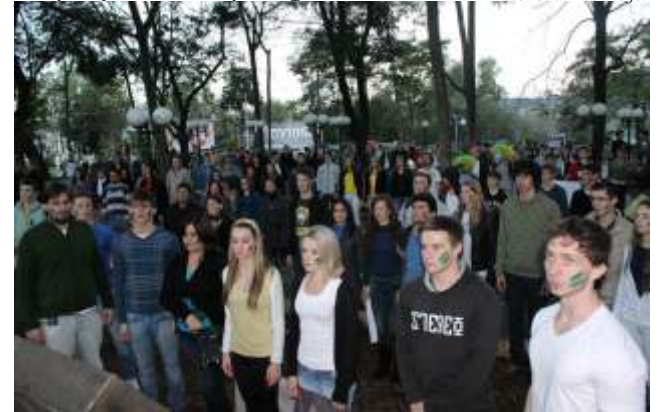
Ruas de Itapiranga receberam vários manifestantes