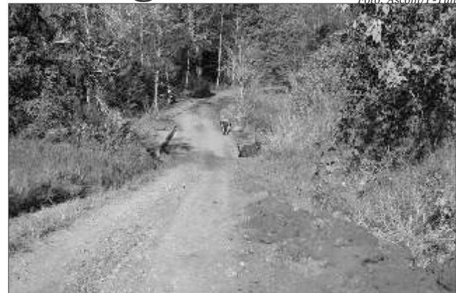
Com a conclusão da obra cerca de 90% das casas terão acesso água tratada

ponsável pelo setor, José Strieder, foram canalizados mais de 680 metros até a propriedade. "Procuramos sempre acompanhar o crescimento populacional, e ter acesso à água tratada é fundamental para o desenvolvimento. Atualmente, 90% das famílias todo município tem acesso à água tratada e canalizada e nosso principal objetivo é atingir 100% das propriedades", ressalta Strieder.