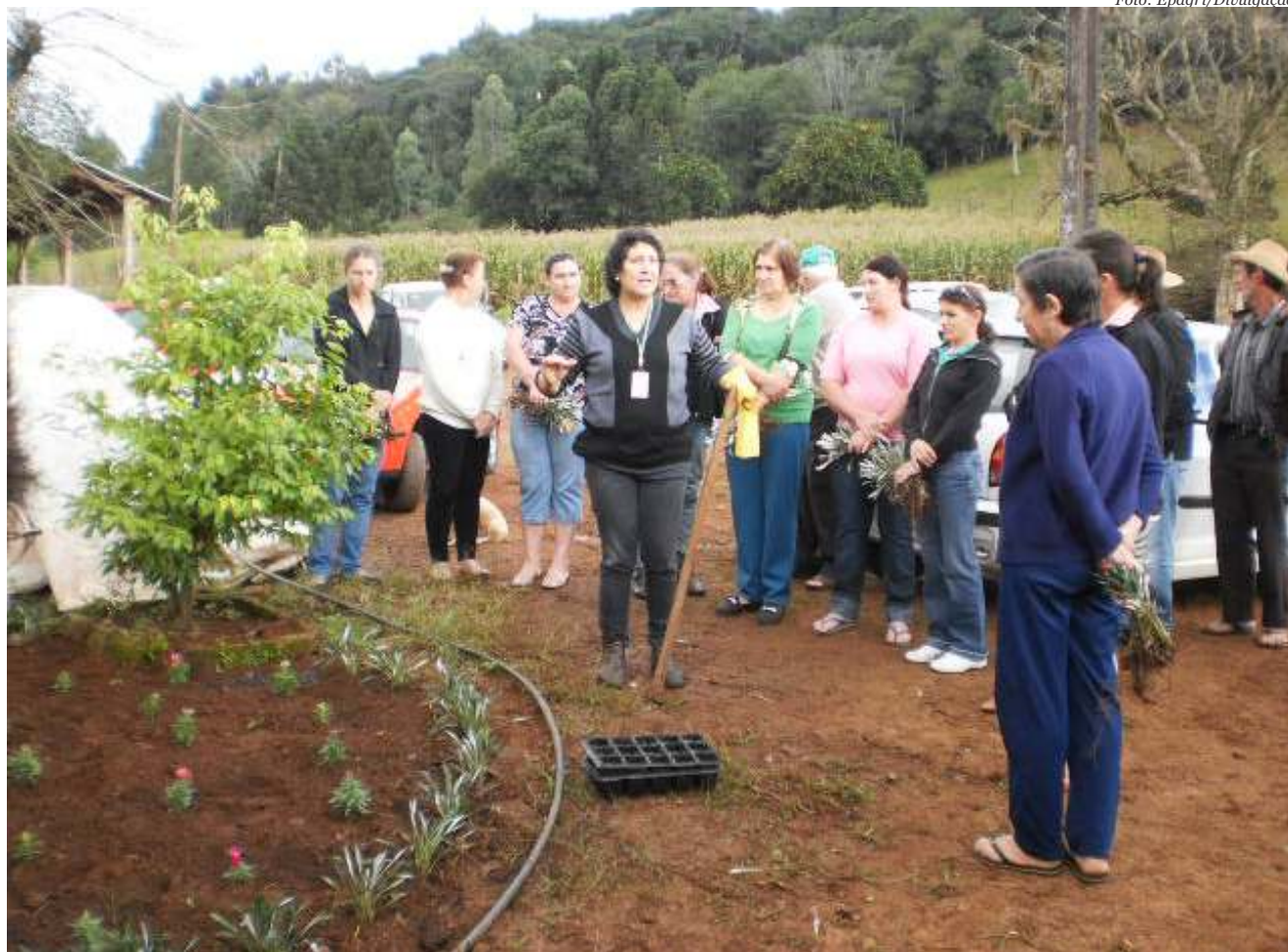
Palestra ministrada pela Epagri abordou técnicas de jardinagem

Belmonte O sindicato dos Trabalhadores Rurais de Belmonte, realizou mais um encontro no dia 28 de maio de 2013, na propriedade de Valmir Volpato, localizada na Linha Laginha, do Programa Nacio-