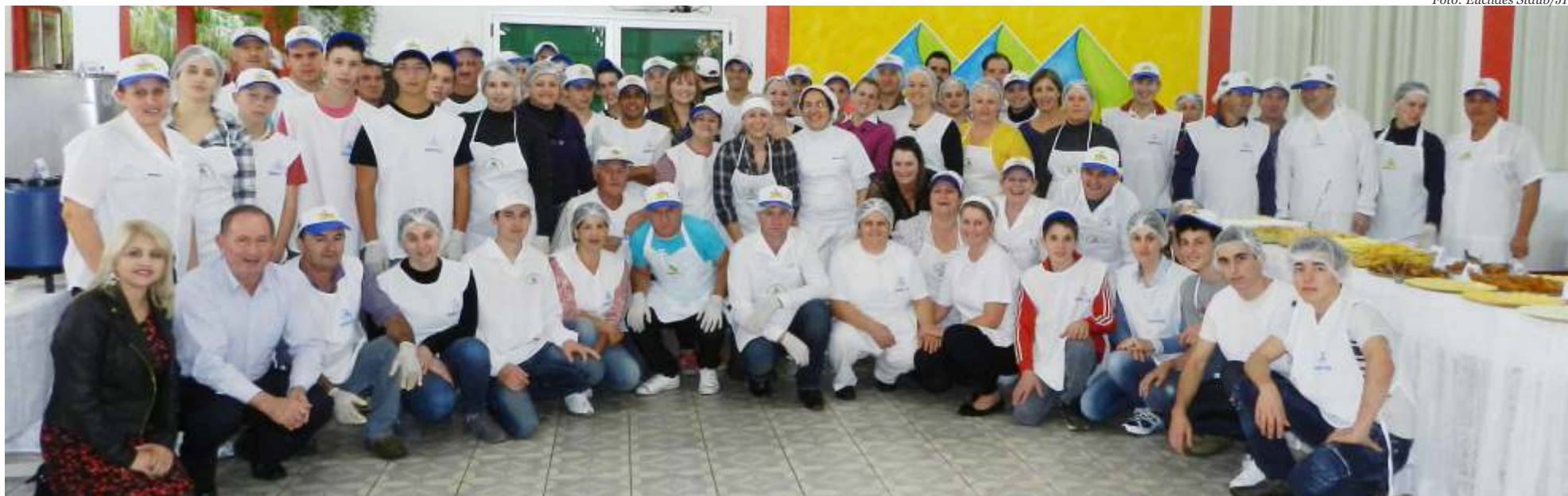
Todos os produtos do dardápio do Café Colômbio foram produzidos pela comunidade escolar

Descanso São Miguel do Oeste O evento que aconteceu nas dependências do colégio agrícola teve mais de mil ingressos comercializados. O público lotou o local para prestigiar o evento na noite de sábado. O já tradicional café colonial é feito com produtos cultivados pelos alunos e a fabricação também acontece na padaria do Cedup.