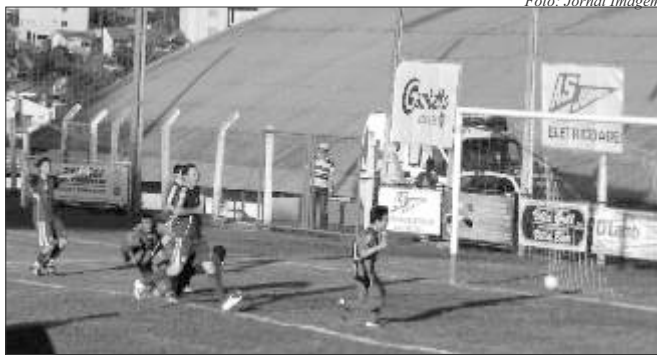
Olavo marcou nos últimos instantes