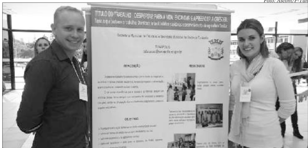
Professores e nutricionistas explicaram sobre a importância de uma merenda de qualidade para o aprendizado dos alunos.