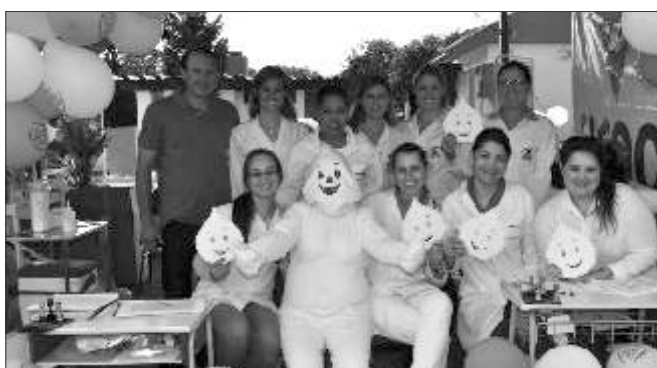
A campanha aconteceu na praça com zé gotinha e brincadeiras para as crianças

Ψ Salete Damian PSICÓLOGA CRP - 12/10870