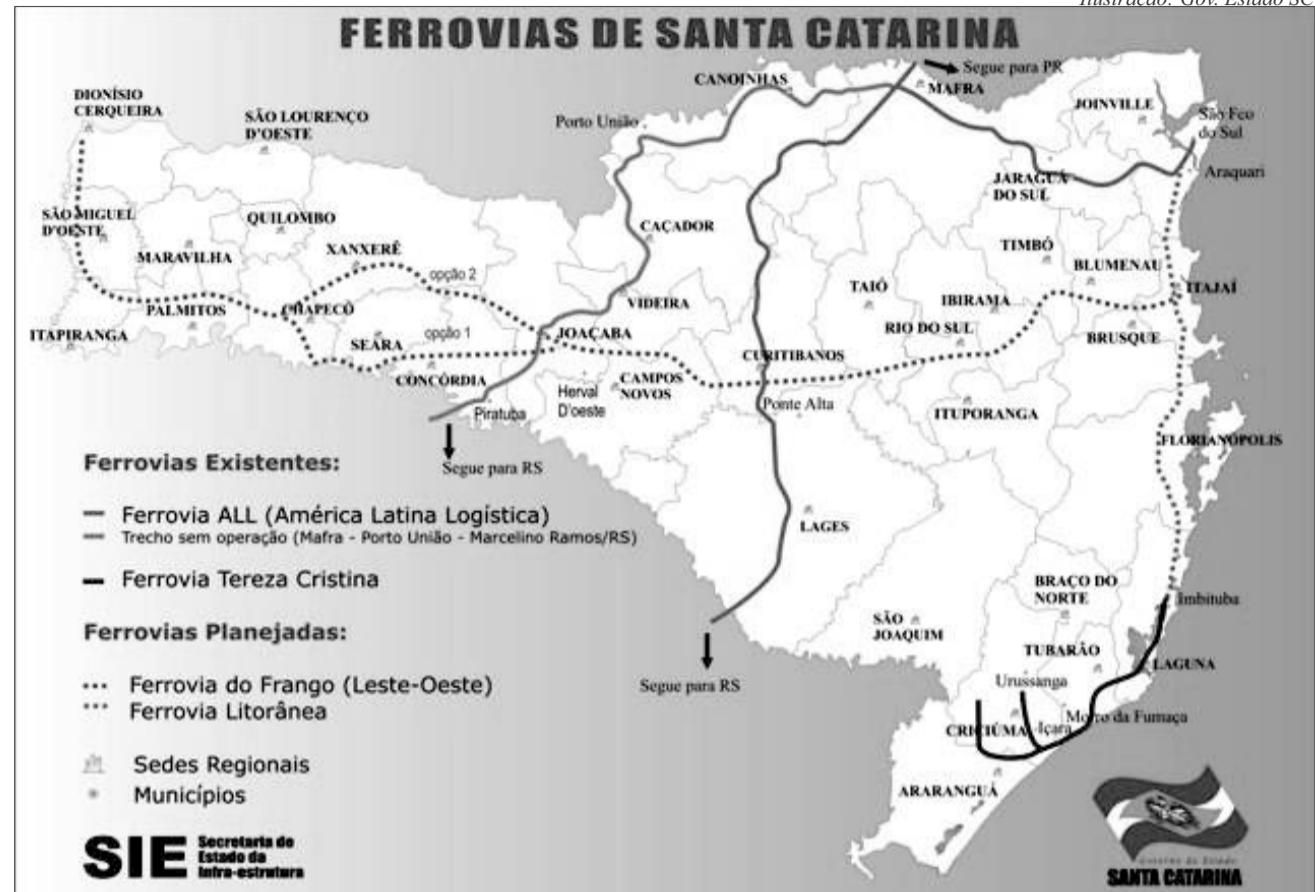
Ilustração: Gov. Estado SC

Brasília O governador Raimundo Colombo recebeu, nesta quarta-feira, dia 3, em Brasília, o parecer favorável para a construção da ferrovia que vai de São Miguel do Oeste a Itajaí, conhecida como Ferrovia do Frango. As obras serão executadas pelo 1º Batalhão Ferroviário de Lages, ligado ao Exército.