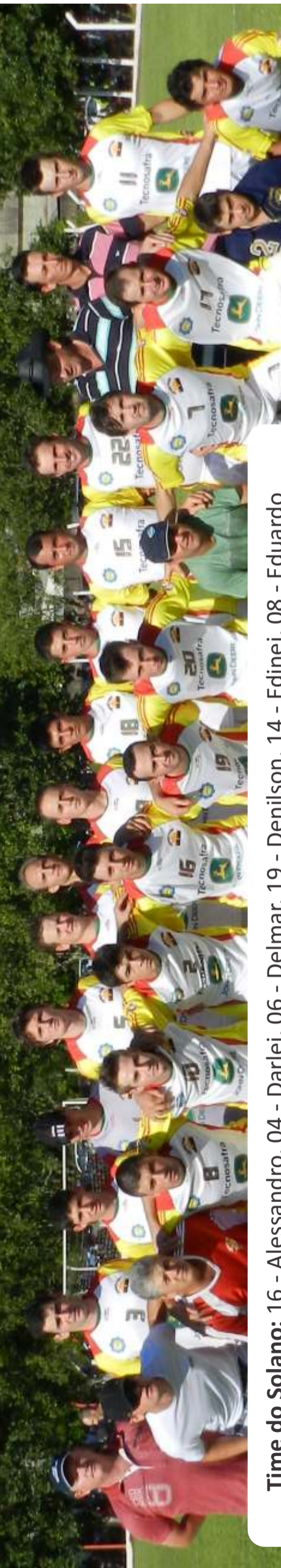
E.C. Itapagé - Vice-campeão

JORNAL IMAGEM 49-3622 0796 oimagem.com.br