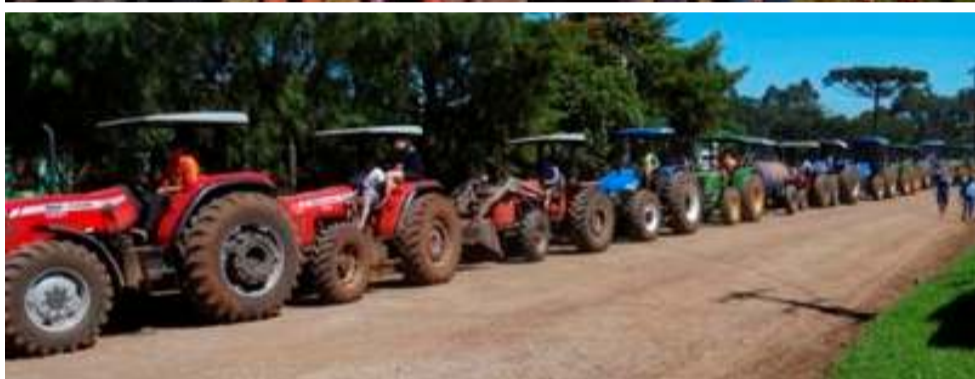
População cobra atenção do Governo do Estado