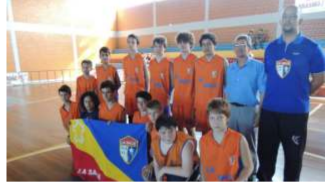
Colégio La Salle Peperi é destaque no basquete