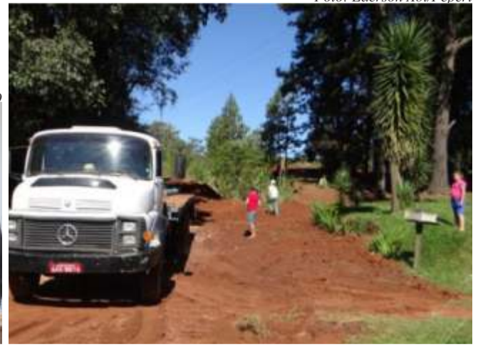
ETA atenderá a população que reside nas áreas onde existe a maior dificuldade na distribuição de água