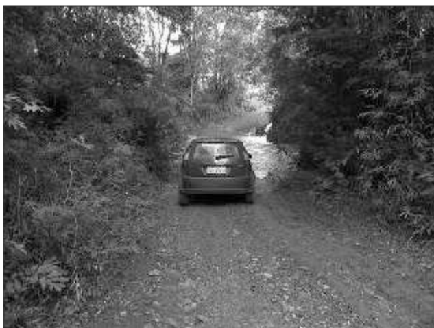
Rio Leste Divisa com Descanso