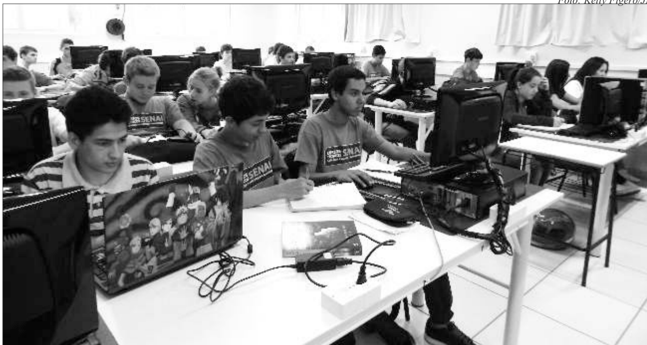
Curso técnico em Redes de computadores oferece laboratórios e equipamento de suporte para formação à distância