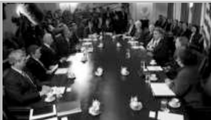
Reunião do presidente Barack Obama: equipe tocando o país mais rico e poderoso do mundo

JK (1956-1961) contou com 11 ministros e 5 titulares do que então se chamavam "órgãos de assessoramento", como os gabinetes Civil e Militar.