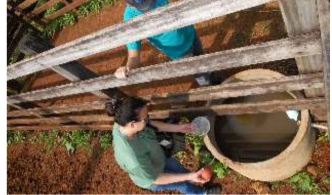
Já são mais de 150 em toda a cidade