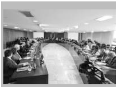
Reunião ministerial da presidente Dilma Rouseff: nem nossos dois imperadores, D. Pedro I e D. Pedro II, dispuseram de tamanho ministério. (Foto: Agência Brasil).

Na semana passada, a comandanta Dilma Rouseff concluiu a sua reforma ministerial. Não como anteriormente, quando reformava o ministério para frear a Cleptocracia (Governo de ladrões), desta vez foi para acomodar correligionários visando sua reeleição em 2014. Apostando na ignorância de seu eleitorado reuniu-se com o maior ministério já visto na História deste país, quicá do mundo.