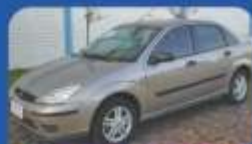
FOCUS SEDAN 2.0 2008

Ofertas válidas até 31/01/2013 ou enquanto durarem os estoques. Financiamento sujeito à aprovação de crédito. Não abrange seguro, acessórios, documentação, o serviço de despoimento, manutenção ou qualquer outro serviço prestado pelo Distribuidor. FAÇA REVISÕES NO SEU VEÍCULO REGULARMENTE.