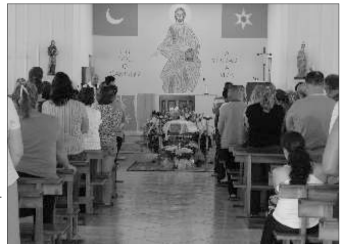
Amigos e familiares deram o último adeus às quatro jovens do Extremo-oeste