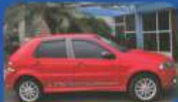
PALIO 1.8R 2008