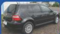
GOLF MI 2.0 2005