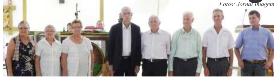
Organizadores do evento