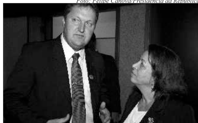
Prefeito Sérgio Theisen e Ministra Ideli

Theisen relatou que, em 2010, foi instituído o consórcio para atender aos 19 municípios da região, abrangendo uma população de 174 mil habitantes - 90 mil no meio urbano e 60 mil na área rural, onde característica econômica é a agroindústria familiar. Por