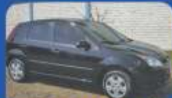
FIESTA HATCH 1.0 2009