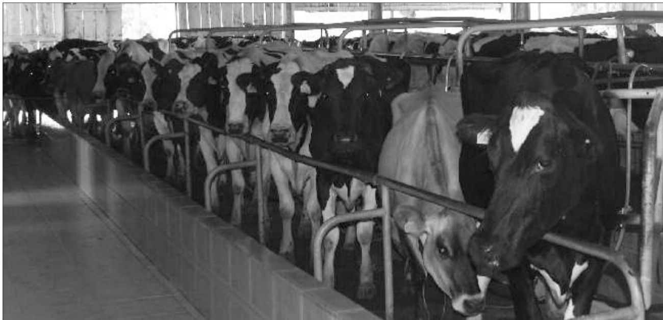
Assentamento tem aproximadamente 190 vacas em lactação