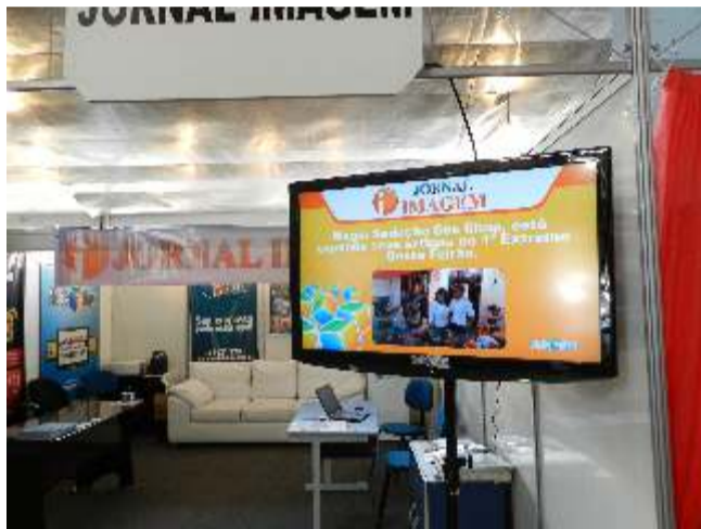
Jornal Imagem e TV Box unidos no Feirão