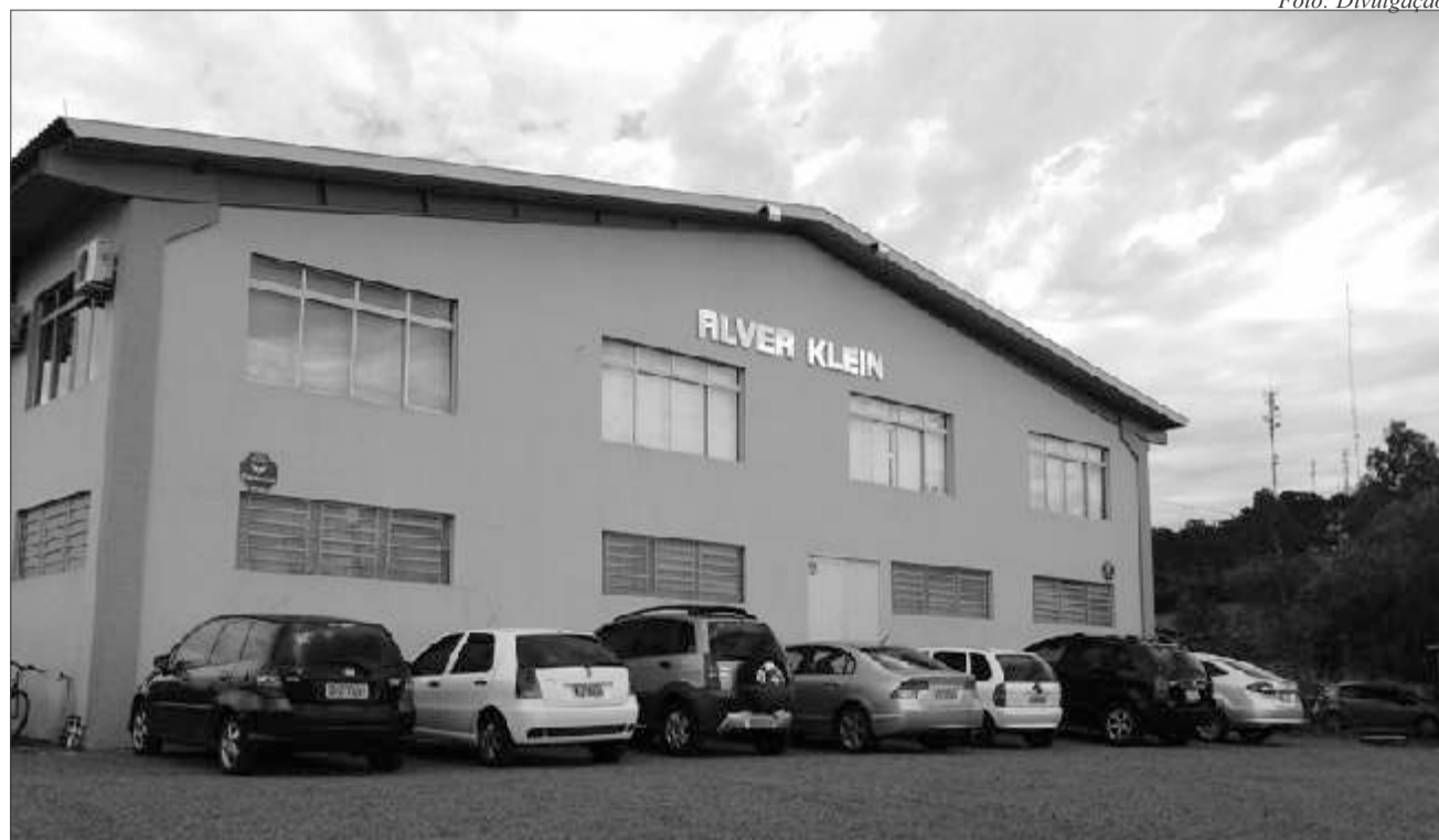
Alver Klein, com sede em Guaraciaba, é tradicional empresa de confecção, há 20 anos no mercado

Tunápolis Alver Klein Industrial, empresa familiar há 20 anos no mercado, anunciou, nas últimas semanas, a instalação de uma filial em Tunápolis. Com a matriz localizada em Guaraciaba, a indústria trabalha na confecção de vestuário masculino para todo Brasil, como calças, camisas, bermudas e jeans.