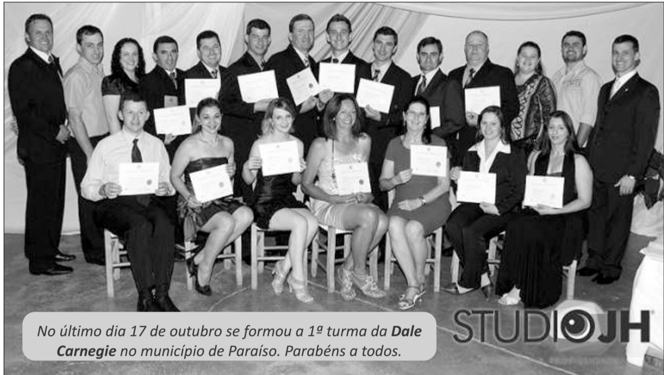
No último dia 17 de outubro se formou a 1ª turma da Dale Carnegie no município de Paraíso. Parabéns a todos.