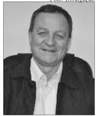
Deputado Federal Valdir Colatto

Quem da cidade dispensa 20%, 35% ou 80% do seu salário, da sua fábrica, do seu apartamento, do seu terreno para preservar o meio ambiente para a sociedade? Pois é isso que acontece no meio rural quando cada propriedade deixa de produzir no percentual determinado pelo Código Florestal e passa a preservar para "salvar a humanidade".