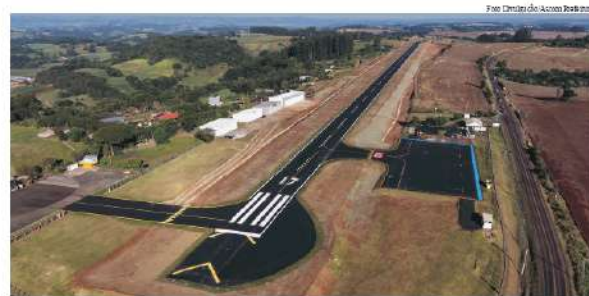
Entre os municípios contemplados com a rota está São Miguel do Oeste. O Aeroporto Hélio Wasun já recebeu melhorias e a revitalização do espaço foi inaugurada oficialmente em maio

“Os aeroportos regionais de Santa Catarina vêm sendo preparados para este momento. Os investimentos feitos na gestão do governador Jorginho Mello qualificaram a infraestrutura aeroportuária, e agora, além da aviação geral, algumas cidades terão a possibilidade de receber voos regulares, conectando-se com a capital”, projeta