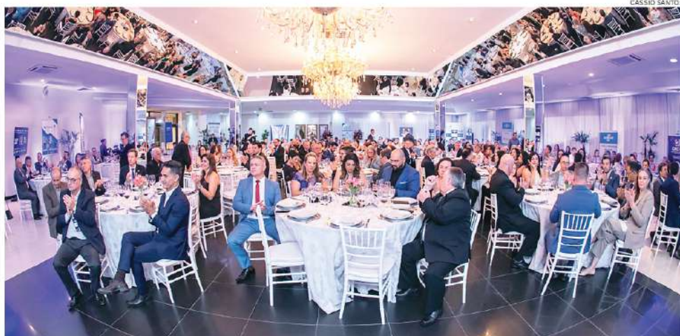
A solenidade de premiação será realizada no sábado (27), no Favorita Golden Hotel, mesmo local da edição de 2025

A categoria Área Acadêmica reconhece produções textuais ou midiáticas desenvolvidas por