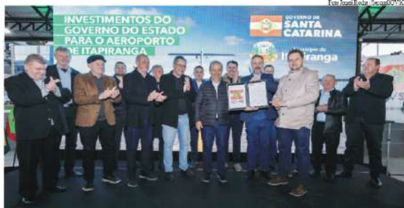
Ato que oficializou a autorização de investimento ocorreu em Itapiranga na terça-feira

O governador Jorginho Mello autorizou na terça-feira, dia 23, investimentos para