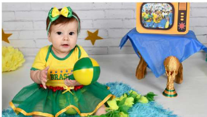
Mãe no clima da Copa do Mundo!