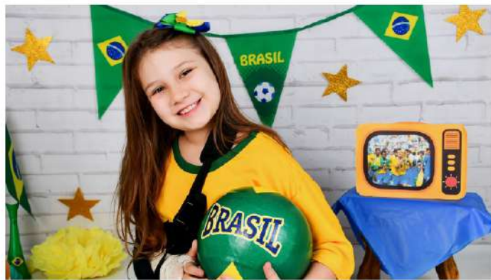
A linda Liê na torcida pelo Brasil na Copa do Mundo!