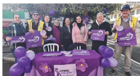
Ação no Calçadão foi promovida pelo Comdipi em parceria com a Secretaria Municipal

nos últimos 20 anos, a população idosa do município e do País, como um todo, praticamente dobrou, o que demanda vários atendimentos voltados a este público, que até então não faziam parte da rotina. O presidente do Conselho pontua que em São Miguel do Oeste, 18 a 20% da população integra a categoria da população idosa, com mais de 60 anos, e o município, terceira melhor cidade de médio porte para quem quer viver mais e melhor, se destaca na atenção e oferta de atividades a este público.