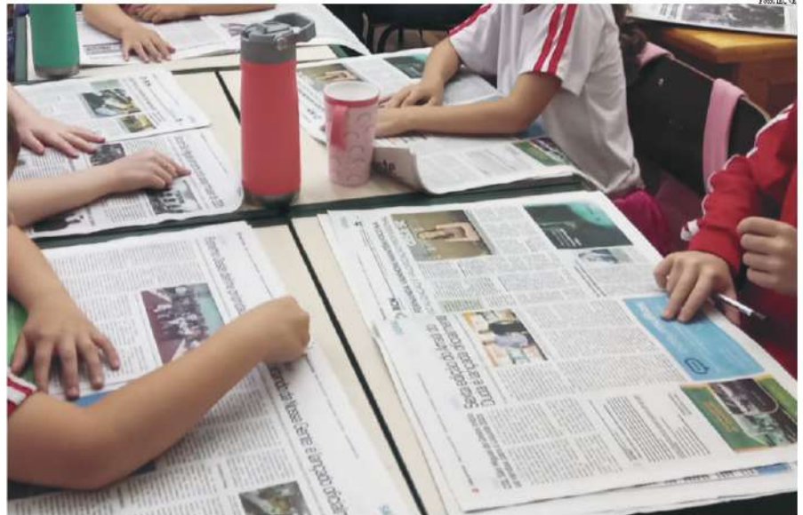
Durante a atividade, os estudantes tiveram a oportunidade de ler diferentes notícias publicadas no Folha do Oeste

A atividade proporcionou momentos de aprendizado, reflexão e criatividade, permitindo que as crianças compreendessem que suas vozes também podem contribuir para o diálogo e para a construção de uma sociedade mais participa-