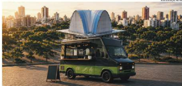
Administração Municipal reforça que a participação da comunidade é fundamental

A Prefeitura de São Miguel do Oeste abriu uma Consulta Pública para discutir a regulamentação da atividade de Food Trucks no município. A população pode participar com sugestões e contribuições até o dia 10 de julho de 2026.