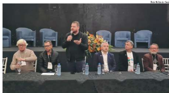
Confira mais detalhes e registros do seminário regional no www.folhadoeste.com.br

Já a Feira do Turismo, realizada no mesmo espaço, possibilitou aos empreendedores apresentar e divulgar seus produtos e o que tem nos seus empreendimentos de turismo. Conforme Fontana, hoje a região conta com mais de 100 empreendimentos ligados ao turismo, sendo a grande maioria já estruturados e recebendo