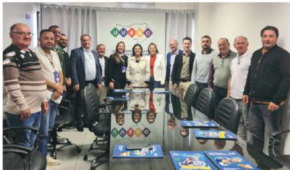
Encontro com os presidentes das câmaras ocorreu paralelo ao evento Uvesc Conecta

A iniciativa busca aproximar os legislativos municipais das principais discussões sobre gestão pública, inovação e fortalecimento institucional.