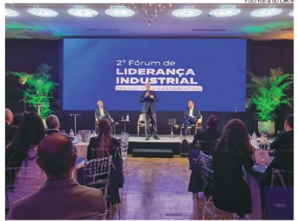
Mais registros e detalhes do evento no www.folhadooeste.com.br