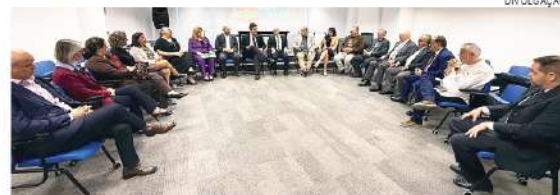
A iniciativa reforça o papel das universidades comunitárias no desenvolvimento catarinense e evidencia a consolidação de um ambiente de cooperação entre academia e poder público