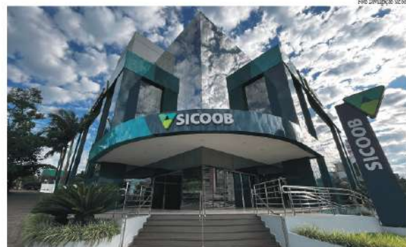
Consulte os valores recebidos por meio do Super App Sicoob, nos terminais de autoatendimento ou nas agências

Dando sequência a essa entrega de valor, no dia 4 de maio, mais de R$ 10,4 milhões foram creditados diretamente nas contas correntes dos cooperados. A distribuição segue critérios proporcionais à movimentação e ao relacionamento de cada cooperado com a cooperativa ao longo do ano, reforçando um modelo justo,