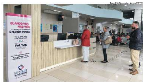
No primeiro quadrimestre, mais de 38 mil pacientes foram atendidos

consultas e exames especializados, com alta demanda de pacientes, sendo referência para 30 municípios da região e ainda regulado pelo Estado para outros municípios de Santa Catarina. No primeiro quadrimestre, mais de 38 mil pacientes foram atendidos, acima da meta pactuada no contrato de gestão. “Reforçamos que o não comparecimento implica diretamente na fila de espera do Estado, pois outros pacientes deixam de ser chamados. A maioria dos faltantes são residentes em São Miguel do Oeste, cidade