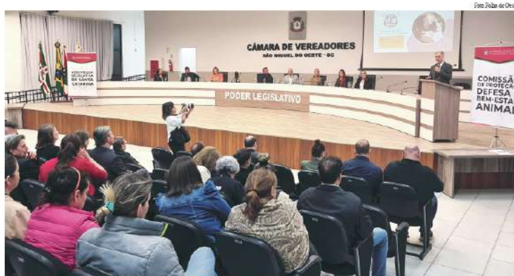
Programação realizada na Câmara de Vereadores de São Miguel do Oeste reuniu participantes da região

Durante a audiência, o deputado ainda ressaltou que as informações levantadas nos encontros têm como objetivo identificar as principais necessidades da causa animal, permitindo a construção de soluções conjuntas e a elaboração de projetos de lei mais eficientes e alinhados à