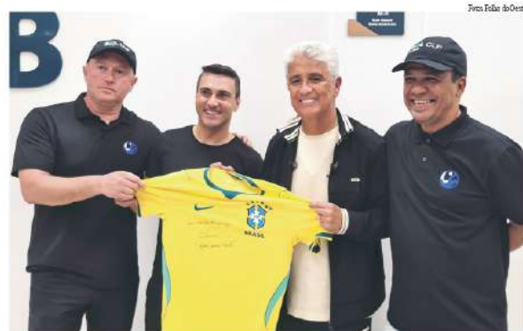
Camiseta do Brasil autografada por Bebeto, ficará disponível no espaço de honra do Sicoob

Como apoiador da iniciativa, o Sicoob reforça seu compromisso com ações que promovem desenvolvimento, oportunidades e impacto positivo nas comunidades onde atua. A competição se destaca por incentivar e dar visibilidade a jovens talentos, reunindo atletas que sonham em construir uma trajetória no futebol. Mais do que a disputa em campo, o evento proporciona experiência, integração, disciplina e contato com um ambiente de projeção, capaz de ampliar horizontes e abrir portas para crianças e adolescen-