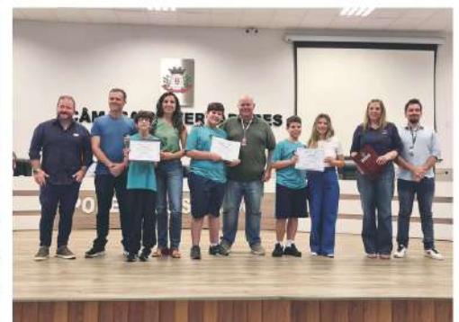
Momento da diplomação dos estudantes do Instituto Educacional CVE