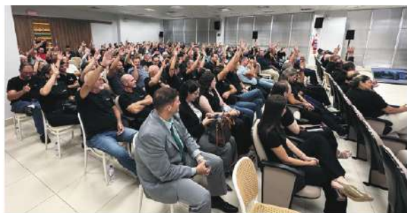
Delegados também aprovaram a atualização do Estatuto Social da cooperativa

reforça a essência do cooperativismo. “Encerramos mais um ciclo com participação expressiva e resultados consistentes. Seguimos valorizando a proximidade com o cooperado, com um atendimento humanizado, baseado na confiança e no relacionamento próximo como um dos nossos principais diferenciais”, finaliza.