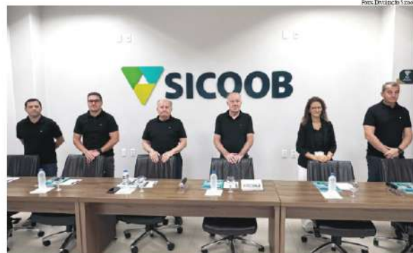
Encontro realizado na última semana marcou o encerramento do ciclo assemblear de 2026

O resultado do período foi de R$ 192 milhões e, como forma de retorno direto, a cooperativa irá distribuir mais de R$ 34 milhões aos cooperados. Desse total, mais de R$ 23,8 milhões já foram pagos em juros ao capital no dia 31 de dezembro e mais de R$ 10,4 milhões em sobras serão creditados em conta corrente no dia 4 de maio, conforme critérios proporcionais à movimentação e ao relacionamento de cada cooperado com a cooperativa.