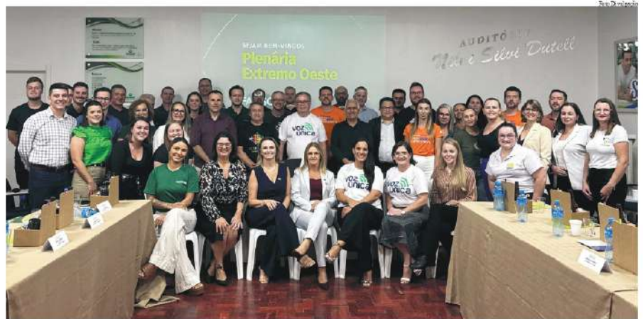
Encontro reuniu lideranças empresariais de diversas associações da região, entre elas representantes da Acismo

Na área da saúde, uma das prioridades é a ampliação do Hospital Regional Terezinha Gaio Basso, com a execução