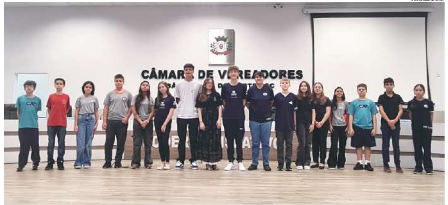
Representantes do Parlamento Jovem 2026. Confira mais detalhes e fotos em www.folhadooeste.com.br