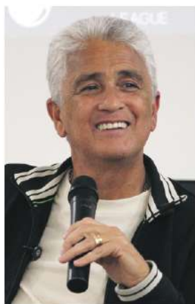
Ídolo do futebol, Bebeto ressaltou a importância de incentivar as categorias de base

Durante a coletiva, Bebeto ainda falou sobre a sua trajetória no esporte, momentos marcantes, e realizações. Confira mais detalhes da programação no www.folhadooeste.com.br .