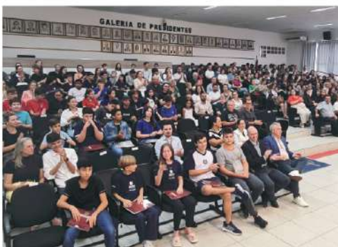
Lideranças, comunidade escolar e familiares acompanharam a sessão

A primeira sessão ordinária do Parlamento Jovem deste ano será na quinta-feira, dia 23 de abril, às 18h.