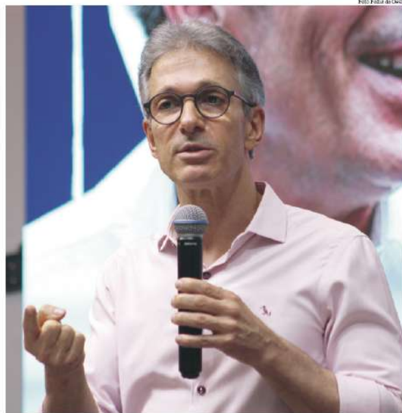
Passagem por São Miguel do Oeste ocorre em um momento em que Zema intensifica sua agenda nacional

Ao avaliar o cenário brasileiro, o pré-candidato ainda apontou a necessidade de melhorar a questão da transparência, desenvolvimento econômico e segurança pública. Ele pontuou ainda a necessidade de uma reforma administrativa, reforma da previdência, e de não complicar a vida de quem trabalha, entre outras iniciativas que considera fundamentais para o crescimento do país. “O Brasil tem jeito”, enfatizou.