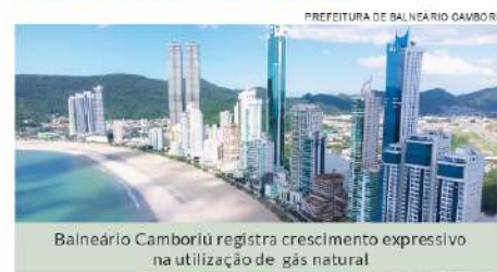
Balneário Camboriú registra crescimento expressivo na utilização de gás natural

A SCGÁS está realizando, em 2026, um importante conjunto de obras de ampliação de sua rede de gás canalizado em Balneário Camboriú.