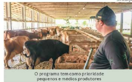
O programa tem como prioridade pequenos e médios produtores

O Banco Regional de Desenvolvimento do Extremo Sul (BRDE) movimentou R$ 83,8 milhões em março, primeiro mês de operação do Pronampe Leite BRDE/SC, iniciativa em parceria com o Governo de Santa Catarina para apoiar produtores do setor. No período, foram aprovadas 3.040 operações de crédito em 196 municípios catarinenses.