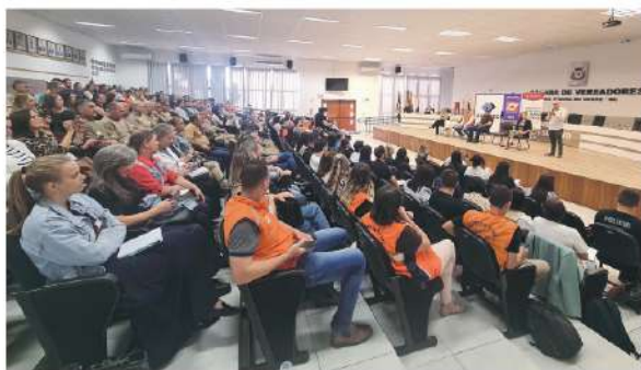
Programação realizada na Câmara de Vereadores reuniu centenas de profissionais da região

As inscrições são gratuitas e devem ser realizadas por meio do endereço eletrônico paznascolas@ale.sc.gov.br até 29 de maio. As produções vencedoras receberão premiação e serão divulgadas nos canais do Parlamento catarinense.